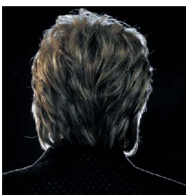
Hillary Clinton

Ook omdat Hillary jaren later, bij het schandaal rond Monica Lewinsky, dezelfde rol op zich nam?