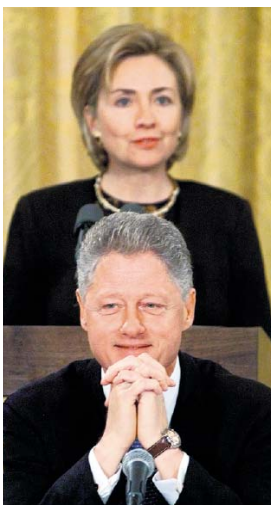
Hillary Clinton spreekt, Bill Clinton luistert