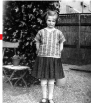
Op kostschool in Baarn, 1925