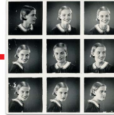
Pasfotoserie Hella - 17 jaar Archief Hella S. Haasse 59c

Het digitale Hella Haasse-museum biedt de onderzoekers grootse mogelijkheden