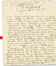
Verhaal 'De jeugd van het sapje Mona'. Transcriptie: 'In een hooge palmboom woonde een apen gezin. Vader en Moeder met drie apjes: Mona, Joko en Titi. Op een warme dag zat moeder ap met haar kleintjes op een weggende palmtak. Papa Aap zat tussen de kokosnoten te dutten'