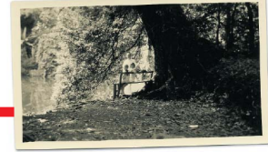
De familie Haasse bij het Javaanse meer van Telaga-Warna, dat later een grote rol speelt in Hella's debuutroman 'Oeroeg'