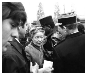
Simone de Beauvoir komt aan in Bobigny voor een rechtszaak over abortus, nov. 1972