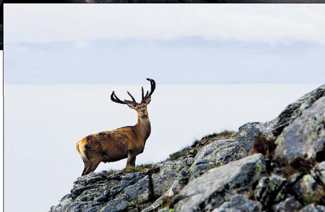
Hert op het eiland

Het eiland Rum voor de Schotse kust is al vijftig jaar in handen van Scottish Natural Heritage. Een deel van de 25 zielen tellende eiland-gemeenschap wil groen en onafhankelijk worden. „We jagen hen van het eiland.”