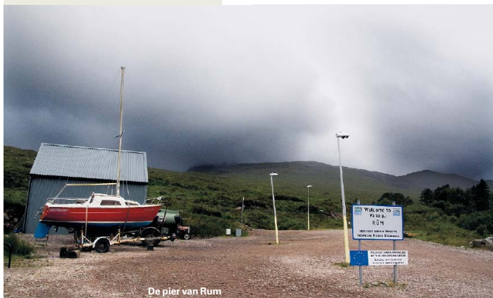
De pier van Rum

www.westword.org.uk die van de lokale krant met alle gemeenschapsroddels van de Small Isles.