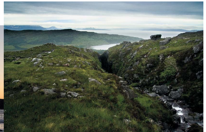
Op het eiland valt 5 meter regen per jaar