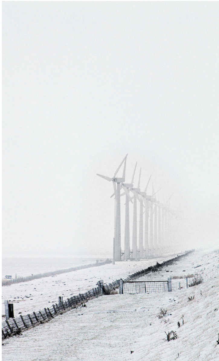
Windmolens langs het IJsselmeer bij Creil.

Zijn vrouw kan niet tegen de herrie en dus zijn ze in Emmeloord blijven wonen. De bewoners van de Noordoostpolder hebben nu al regelmatig de indruk dat ze niet op het platteland maar in een industriegebied wonen.