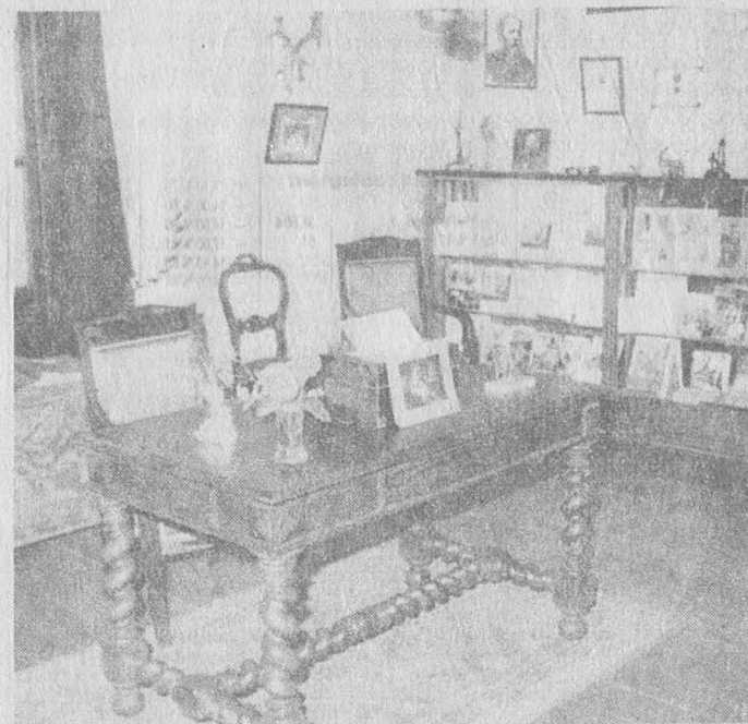
Le bureau et tout le mobilier du cabinet de travail d'Eugène Le Roy que l'on peut voir au musée des traditions populaires

Une exposition à ne pas manquer pour découvrir ou percevoir différemment et plus avant un Périgordin qui marqua à tout jamais son terroir et qui repose au cimetière de Montignac.